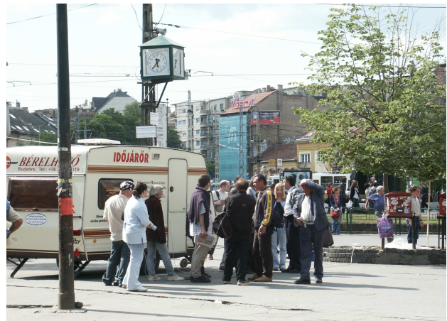
Időjárór, Moszkva tér, 2003