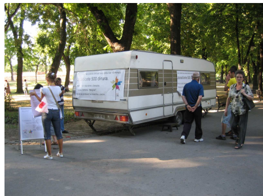
Időjárór, Belgrád, 2007