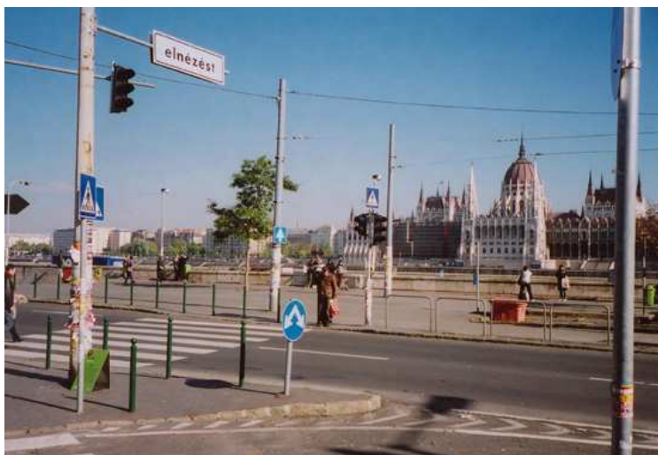
Elnézést, Batthyany tér, 2004

Ezt a munkámat 2004-ben és 2005-ben már a PONT:ITT:MOST pályázat keretében már kiviteleztem, és két budapesti helyszín arra alkalmas lámpaoszlopán kiállítottam.