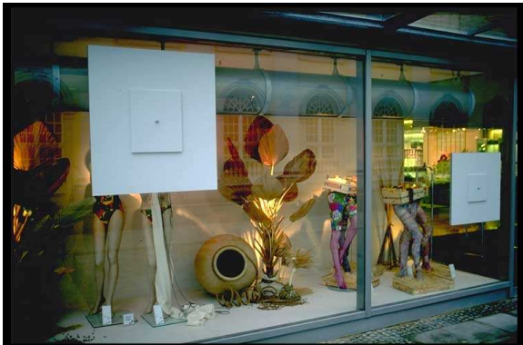
Betörött kirakat, Kassel 1992