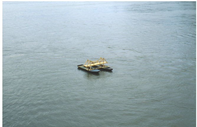
Úszó híd, Esztergom – Sturovo, 1997