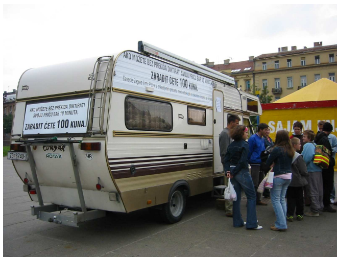
Időjárór, Zágráb, 2004