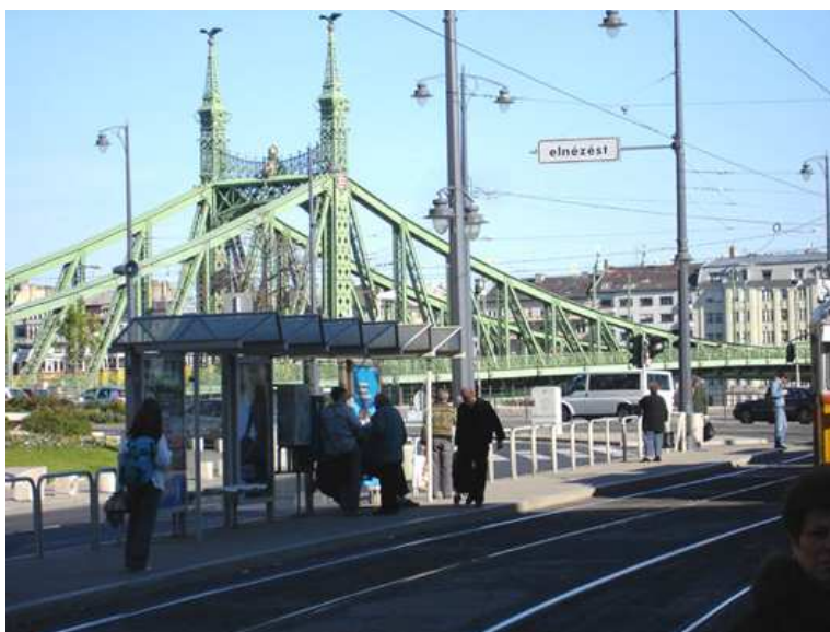
Elnézést, Gellért tér, 2005