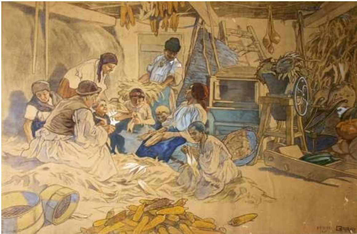
2 alkotás az buszmegállók üvegfelületeire felmatricázott Garay Ákos grafikák közül