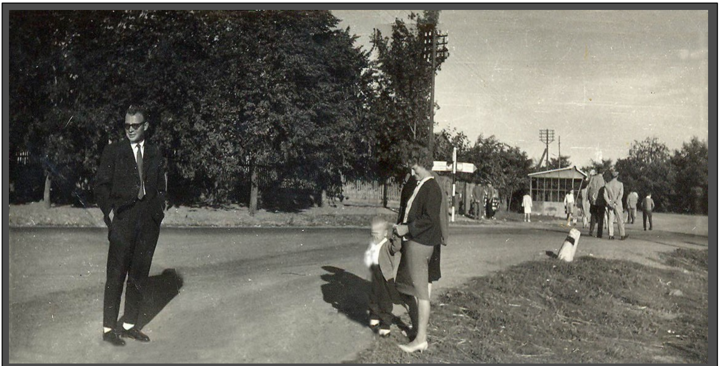
A kiállított művek között szerepel több különálló képből összevágott panoráma hatású kép is. (alsó kép - 1964-es szedresi központ egy részlete)