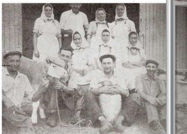
Termelészövetkezeti tagok (1961)