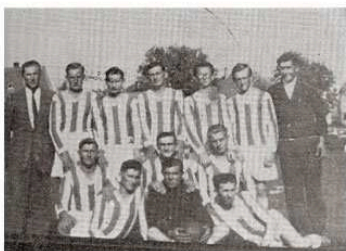
A falu futballesapata: 1948-ban

A közösségeknek elsősorban az önmeghatározás végett van szükségük a múltra. Egy mikroközösség identitása nagyban függ kollektív emlékezetének konstrukciójától. Munkám témájaként ebből a rendszerből választottam ki két nagyon fontos alapelemet: a nyelvet, valamint a rítusokat és ünnepeket.