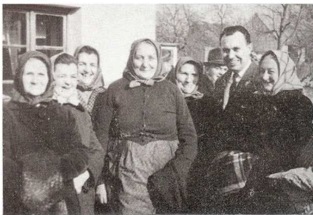
Dr. Korom Mihály elvtárs igazságügyi miniszter a termelészövetkezetek asszonyaival (1969)

A közösségeknek elsősorban az önmeghatározás végett van szükségük a múltra. Egy mikroközösség identitása nagyban függ kollektív emlékezetének konstrukciójától. Munkám témájaként ebből a rendszerből választottam ki két nagyon fontos alapelemet: a nyelvet, valamint a rítusokat és ünnepeket.